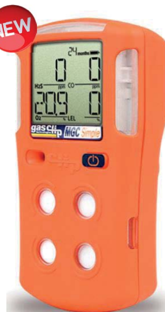
ART.GC.MGCP RILEVATORE MULTI GAS (4 GAS) O2, CO, H2S, LEL

Semplice utilizzo con un solo pulsante, datalogger standard, nr. 30 registrazione eventi. Offre una conferma visiva continua delle sue condizioni operative e di efficienza. Guscio di protezione anti-urto. Schermo LCD continuo mostra le concentrazioni di gas contemporanee per H2S, CO, O2 e combustibili (0-100% LEL). Alimentato tramite batteria litio (in genere 25 ore di funzionamento; ricarica in meno di 4/6 ore). Suoneria di allarme e larghe barre di allarme luminose (tipico), allarme interno vibrante per aree molto rumorose. Interamente compatibile con test automatico docking station. Test automatico di integrità per: integrità circuito, batteria, sensore e allarmi acustici/visivi.