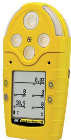
ART.BW.MC5PID RILEVATORE MULTIGAS "GASALERTMICRO 5 PID" (SOSTANZE CHIMICHE ORGANICHE VOLATILI)

Ineguagliato nella sua versatilità, può monitorare e visualizzare fino a 5 potenziali gas presenti nell'atmosfera. Semplicità d'uso e di calibrazione, Test automatico di controllo Custodia robusta ed anti-shock. Tre tipi di allarme (udibile, visivo e vibrante). Quattro livelli di allarme: Basso, Alto, TWA e STEL. Dotato di suoneria di allarme a 95 dB e due larghe barre di allarme luminose. Display retro illuminato a LCD con opzione di retroilluminazione. Water-resistant.