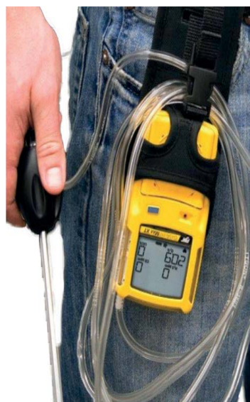
ART.BW.44370080 RILEVATORE GASALERT MAX XTII con pompa di campionamento integrata e datalogger

Rilevatore multigas con pompa di campionamento integrata, può controllare in modo affidabile e sicuro fino a quattro gas pericolosi e abbina un semplice funzionamento con comando ad un solo pulsante con una pompa di campionamento integrata. Compatto, leggero e resistente all'acqua, attiva allarmi visivi, acustici e a vibrazione in condizioni di allarme BASSO, ALTO, TWA o STEL con set point di allarme per tutti i sensori definibili dall'utente. La nuova pompa integrata rende l'accesso a spazi confinati ed il campionamento a distanza, semplici come non mai, dotato di tubo di campionamento standard di mt. 3 (a richiesta è possibile fornire il tubo fino ad una lunghezza di metri 20). E' provvisto di batterie ricaricabili NiMH. Dimensioni: 13,1 x 7 x 5,2 cm (H x L x P). Peso: 316 g. Norme: ATEX Ex -20 +50°C / IP 66/67.