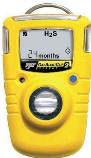
ART.BW.44370085 RILEVATORE MONOGAS GASALERTCLIP EXTREME "CO 24 MESI"

Rilevatore monogas non richiede taratura, sostituzione dei sensori né sostituzione o carica della batteria. GasAlertClip Extreme è compatibile con la stazione automatica di controllo MicroDock II; la sua semplicità, insieme a minime esigenze di addestramento e costi di manutenzione irrilevanti, lo rende uno degli strumenti di protezione più convenienti sia per il personale interno che per i collaboratori esterni. Ampio display LCD, visualizza esposizioni allarme picchi incontrati su richiesta, autotest giornaliero attivato dall'utente, allarme interno a vibrazione per ambienti ad alta rumorosità, trasmette eventi di allarme gas. Dimensioni: 2,8 x 5,0 x 8,1 cm. Peso: 76 g. Valutazioni: EMI / RFI: