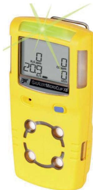
ART.BW.44370369 RILEVATORE MICROCLIP XL (4 GAS)

ART.BW.CLIPHB-CASE: guscio di ibernazione 24/36 mesi H2S/CO.