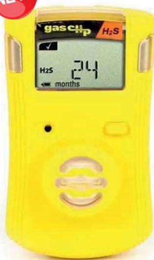
ART.GC.SGC RILEVATORE MONOGAS "24 MESI" H2S-CO-O2

Affidabilità del sensore senza pari per H2S, CO o O2. Set point di allarme regolabili e capacità di lettura del gas in tempo reale.