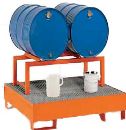
ART. SB.E202 VASCA A TENUTA STAGNA A NORMA DI LEGGE PER 4 FUSTI

Vasca a tenuta stagna per deposito di sostanze pericolose e inquinanti a norma di legge. Predisposto per la movimentazione con pallet. Consigliato per quattro fusti da 200 litri. (SENZA SUPPORTO)