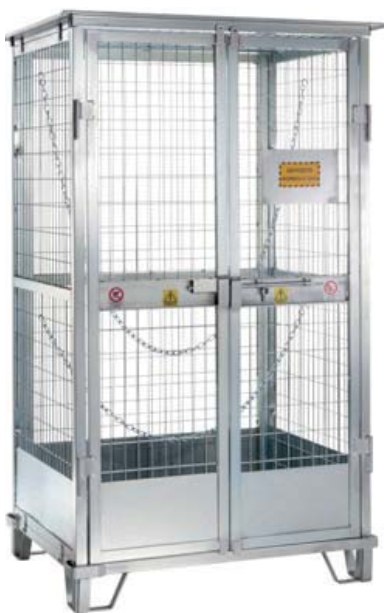
ART. SB.DEPBOMB DEPOSITO 9/12 BOMBOLE

Pareti a griglia con fondo chiuso. Due ante a battente con chiavistello, predisposte per la chiusura con lucchetto. Viene consegnato montato. Struttura in acciaio particolarmente robusta, saldata e zincata a fuoco per l'impiego in ambienti esterni. Entrate forche.