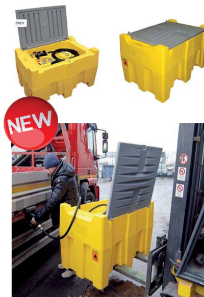
ART.C.SER440 SERBATOIO PER GASOLIO-ESENZIONE ADR 1.1.3.1 .C

Serbatoio in PE da trasporto con pompa elettrica. Contatore e pistola con arresto automatico con 4 m di tubo carbopress, 4 mt di cavo elettrico e pinze per il collegamento alla batteria. Serbatoio per gasolio trasportabile prodotto in polietilene lineare con stampaggio rotazionale. Procedimento che rende la struttura compatta ma allo stesso tempo leggera. La dotazione comprende: tappo di carico in alluminio da 2, tappo di sicurezza a doppia valvola. Rubinetto di sicurezza gruppo di travaso. Raccordo girevole imbocchi per il sollevamento a pieno con forche. Impugnatura per il sollevamento a vuoto..