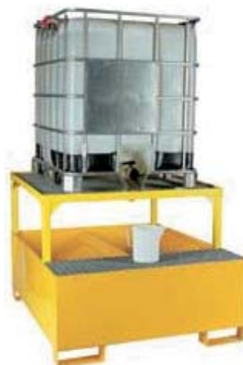
ART.SB.E207 VASCA INCLINATA PORTACISTERNA

Dimensioni cm.: larg. cm. 134, prof. 125, altezza 30 cm.