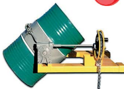
ART.C.MOV890 RIBALTAFUSTO INFORCABILE

Ribaltafusto inforcabile a diametro fisso per fusti da 200 litri. Portata 500 kg. Rotazione frontale manuale (volantino e riduttore con rapporto 1:70).