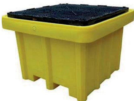
ART. SB.PE1000 VASCA PER 1 CISTERNETTA

Vasca in polietilene per cisterna da 1.000 litri.