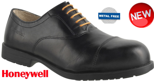
ART.BA.6543016 - SCARPA "ELEGIO" EN20345 - S3 CI SRC